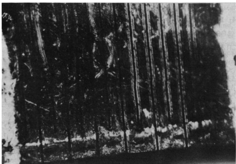
Рис. 1. Ограничительное сопротивление в виде «змейки», размером 1 \times 2 \text{ мм}^2 , изготовленное лазерным фрезерованием на пленке \text{Y}_1\text{Ba}_2\text{Cu}_3\text{O}_{7-x} .

рений f = 10^3 Гц, мощность излучения в импульсе 1–6 кВт). На рис. 1 представлена фотография ограничительного сопротивления с заданной топологией рисунка изготовленного лазерным фрезерованием на специализированной технологической установке, управляемой от вычислительного комплекса «Искра-125Б». Ширина токопроводящей дорожки 60 мкм при ширине лазерного реза 8 мкм, общая длина токоведущей дорожки составила 30 мм. После лазерной обработки сопротивление ВТСП пленки при комнатной температуре возросло до 16 кОм.