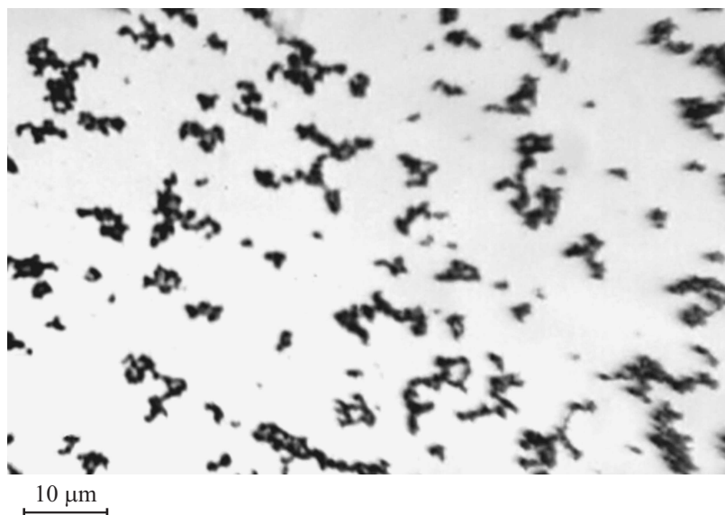
Рис. 1. Микрофотография спонтанно намагниченных агрегатов, полученная с помощью оптического микроскопа методом просвета тонкого слоя магнитной жидкости, нанесенного на предметное стекло.

ным полем, обусловленные внутренними вращениями содержащихся в ней намагниченных агрегатов.